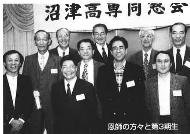
恩師の方々と第3期生