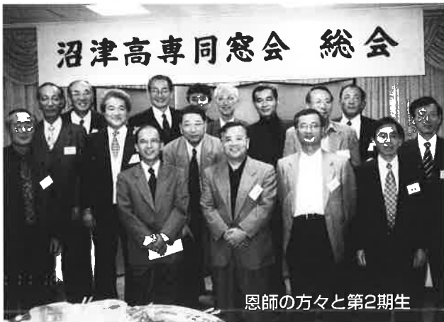
恩師の方々と第2期生

97年度沼津高専同窓会総会は、97年11月16日(日) PM1:00より、東京霞ヶ浦ビル33F東海大学校友会館にて開催しました。