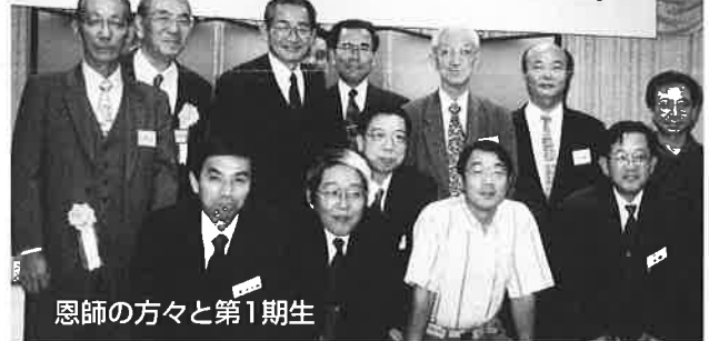
恩師の方々と第1期生