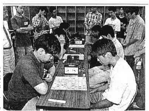
熱の入った接戦となった団体戦決勝。沼津高専A-秋田高専A-御殿場市中畑の国立中央青年の家

御殿場 全国高専将棋始まる 第一回全国高専将棋大会(沼津高専主催、静岡新聞社・SBS静岡放送など後援)が二十二日、御殿場市中畑の国立中央青年の家で始まった。初日は団体トーナメントと個人予選リーグを行い、団体戦は第一回大会の覇者、沼津高専Aチームが秋田高専Aチームを下して連続優勝を決めた。全国の高等十三校から団体戦に二十チーム、個人戦に六十八人がエントリーした。三人組の団体戦の決勝は前回大会と同カードとなった。息詰まる対局の末、