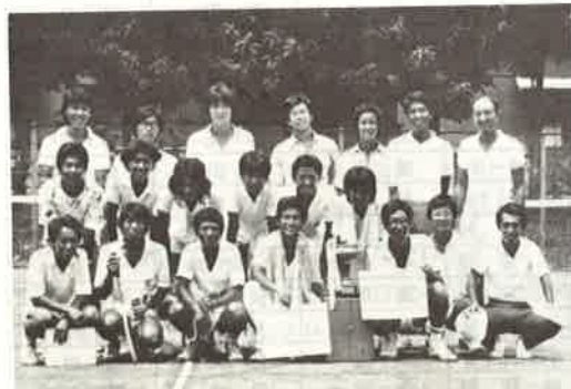
喜びの軟式庭球チーム

結果は沼津、豊田、岐阜の3校が3勝1敗で並び総勝組（勝点）でも、ともに同数となり、かろうじて総勝セット数でまさり、辛くも念願の団体優勝を達成した。