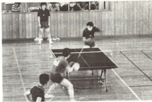
卓球 沼津強し、快勝する。

卓球は初戦、強敵鳥羽と当り、事実上の決勝戦となり白熱した好ゲームとなった。対戦成績2対2のあと沼津はエースが出場し、辛うじて初戦をものにした。この勢いに乗った沼津は他3校をものともせず快勝した。